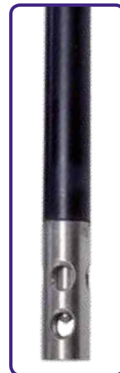
VPT 51/01 Per misure acqua ultra pura